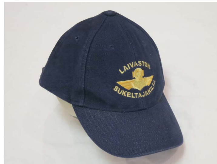
#8: Lippalakki 15 €, Navy Blue