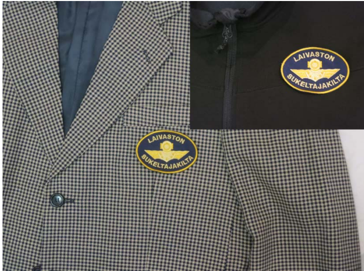
#5: Kangasmerkki 10 €