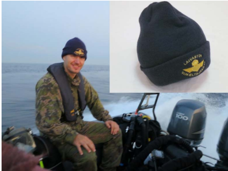
#1: Pipo 15 € Thinsulate 40 gr.