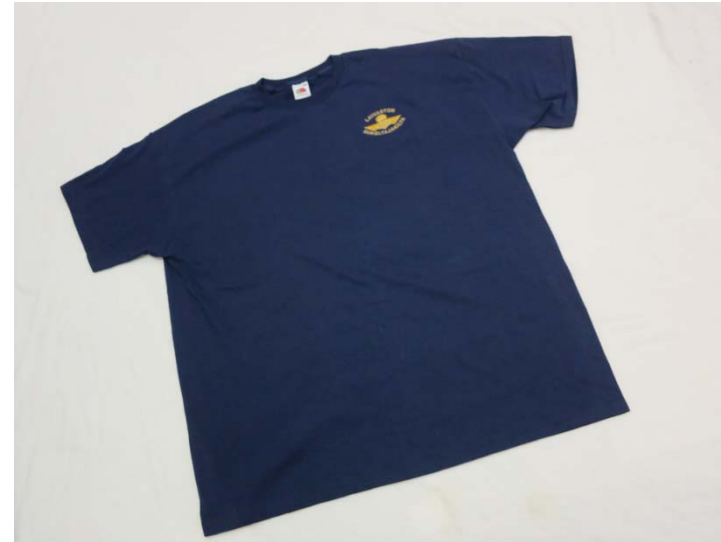
#3: T-paita 20 €