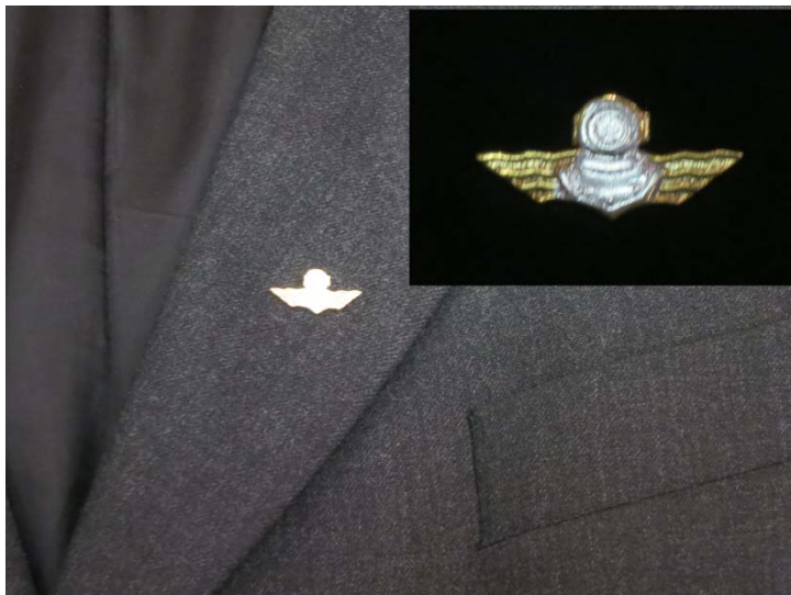
#6: Jäsenpinssi 30 €, hopeinen