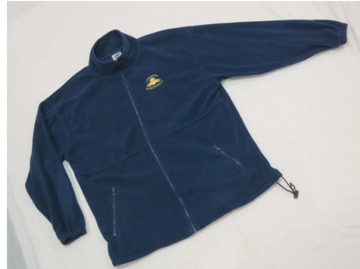
#7: Fleece takki 45 €