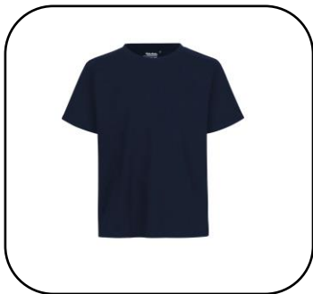
Unisex T-paita Navy 10€