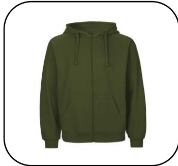
Huppari Oliivi 55€