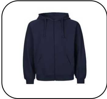
Huppari Navy 55€

Nyt voit tehdä ennakkotilauksen Kenttäkaupan uusista vuoden 2024 tuotteista! Lähetä määrä, koko ja väritiedot osoitteessa: www.mpkl/kenttakauppa.fi Kaikkiin tuotteisiin tulee velcropinta hihaan + liiton tornilogo rintaan. Hinnat Kenttäkaupassa ovat kpl hintoja. Kokoamme ennakkomyynnit helmikuun ajan OGG:n maahantuojalle. Kokonaistilausmäärä määrittelee tuotteen lopullisen € hinnan. Huom.! Pilottitakki on myynnissä vain Kenttäkaupassa, joten tuote on ainutlaatuinen!