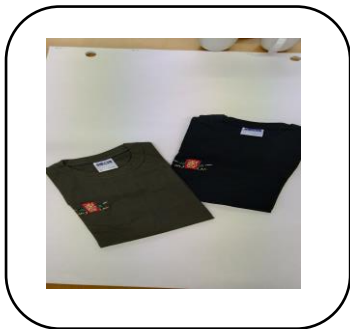
Suomen Sotilas T-paita (ajakokoja L-XXXL) 5€/kpl