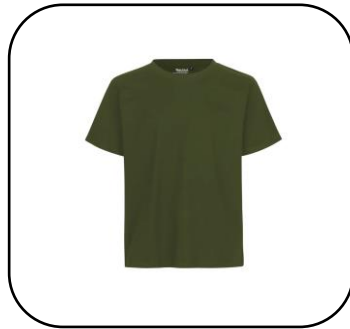
Unisex T-paita Oliivi 10€