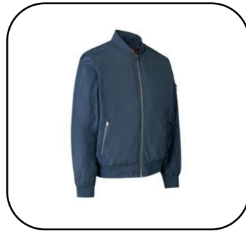
Pilottitakki Navy alk. 90€