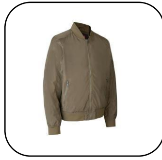
Pilottitakki Oliivi alk. 90€