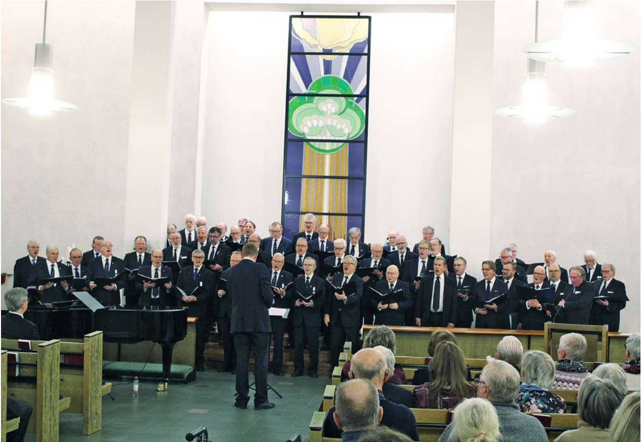
Oulun Tammenlehväkuoro ja Pohjan Laulu esiintymässä Kempeleen Pyhän Kolminaisuuden kirkossa (SS).