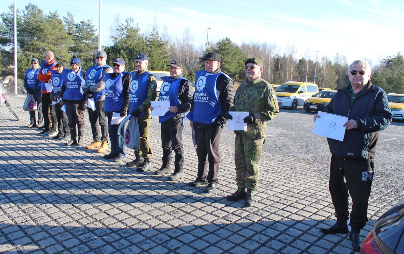
Paikallisten maanpuolustusjärjestöjen jäsenet valmiina kuljettamaan varusmiehiä keräyskohteisiin.