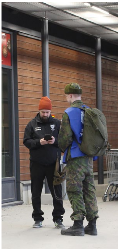
Kuvassa käynnissä Mobilepay maksetapahtuma keräyksen Kaakkurin City-Marketin kulmalla.

noin 400. Keräyksillä tuetaan myös soitaorpoja. Veteraanien keski-ikä on noin 100 vuotta, ja heidän puolisoiden ja leskiensä keski-ikäkin on yli 90 vuotta.